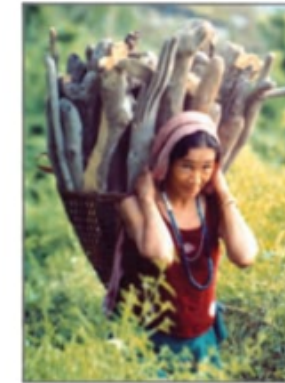
चित्र 3.9 : उत्तर पूर्व भारत में ईंधन ले जाती महिला

पौधों और जानवरों के अवशेष जो लाखों वर्षों तक धरती के अंदर दबे रहे थे, ताप और दाब के प्रभाव से जीवाश्मी ईंधनों में परिवर्तित हो गए। जीवाश्मी ईंधन, जैसे कोयला, पेट्रोलियम और प्राकृतिक गैस परंपरागत ऊर्जा के मुख्य स्रोत हैं। इन खनिजों के भंडार सीमित हैं। विश्व की बढ़ती जनसंख्या जिस दर से इनका उपयोग कर रही है वह इनके निर्माण की दर से कहीं अधिक है। इसलिए ये शीघ्र ही समाप्त होने वाले हैं।