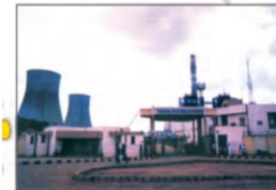
चित्र 3.10 : तापीय ऊर्जा संयंत्र का दृश्य

पौधों और जानवरों के अवशेष जो लाखों वर्षों तक धरती के अंदर दबे रहे थे, ताप और दाब के प्रभाव से जीवाश्मी ईंधनों में परिवर्तित हो गए। जीवाश्मी ईंधन, जैसे कोयला, पेट्रोलियम और प्राकृतिक गैस परंपरागत ऊर्जा के मुख्य स्रोत हैं। इन खनिजों के भंडार सीमित हैं। विश्व की बढ़ती जनसंख्या जिस दर से इनका उपयोग कर रही है वह इनके निर्माण की दर से कहीं अधिक है। इसलिए ये शीघ्र ही समाप्त होने वाले हैं।