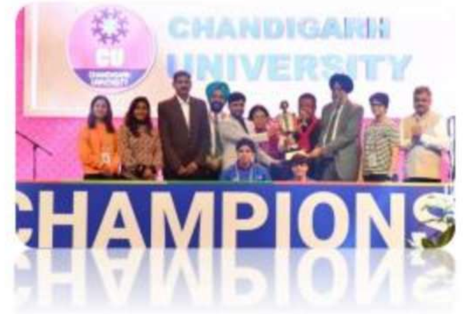
KIUG medal winners