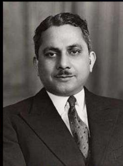
Benegal Rama Rau