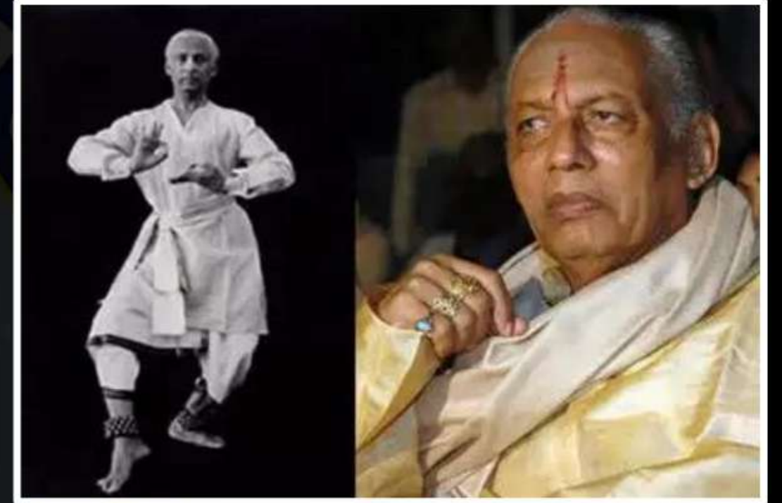
Vempati Chinna Satyam