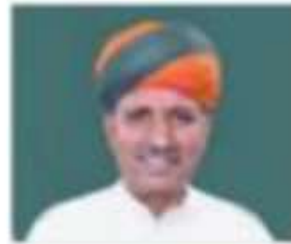
Shri Arjun Ram Meghwal

Contact Facebook Account Twitter Account