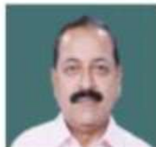
Dr. Jitendra Singh

Contact Facebook Account Twitter Account