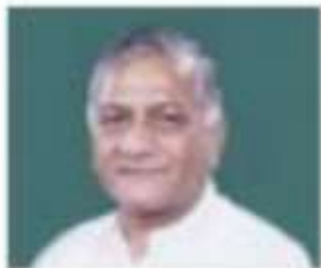
General (Retd.) V.K. Singh

Contact Facebook Account Twitter Account