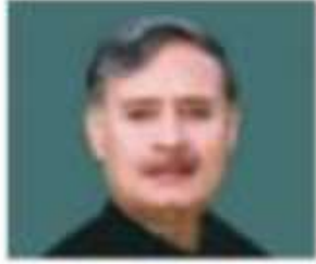
Shri Rao Inderjit Singh