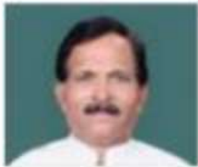
Shri Shripad Yesso Naik

Contact Facebook Account Twitter Account