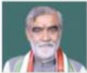
Shri Ashwini Kumar Choubey

Contact Facebook Account Twitter Account