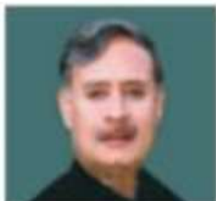
Shri Rao Inderjit Singh