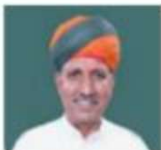
Shri Arjun Ram Meghwal