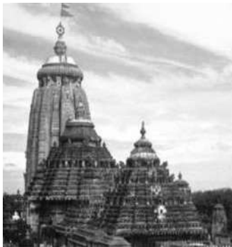
लिंगराज मंदिर, भुवनेश्वर