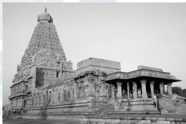
बृहदेश्वर मंदिर, तंजौर

प्रश्न- मंदिर वास्तुकला के विकास में चोल वास्तुकला का महत्वपूर्ण योगदान क्या है, (UPSC-2013, 100 शब्द)