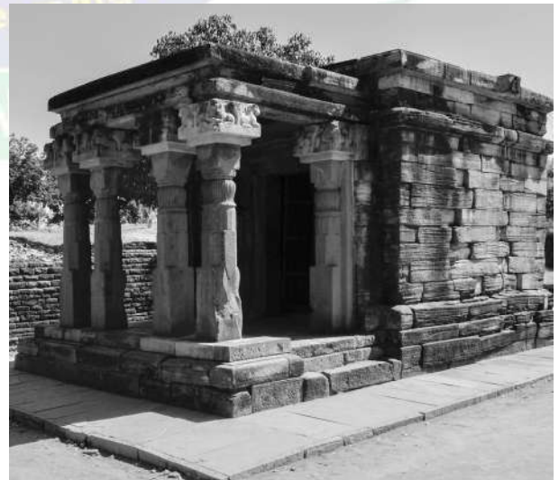
साँची का प्राचीन मंदिर

• इमारती मंदिर : गुप्तकाल भारतीय मंदिर स्थापत्य की दृष्टि से महत्वपूर्ण समय का प्रतिनिधित्व करता है। हालाँकि, इस काल में मंदिर स्थापत्य अपनी शैशवावस्था में था, किंतु इसमें एक विकासक्रम भी दृष्टिगोचर है। इस काल का सबसे आरम्भिक उदाहरण साँची का मंदिर संख्या-17 है। इसके साथ ही इस समय तिगवा का विष्णु मंदिर, भूमरा और खोह का शिव मंदिर, नचनाकुठार का पार्वती मंदिर, दह पर्वतिया मंदिर (असम) तथा देवगढ़ का दशावतार मंदिर प्रमुख हैं। देवगढ़ का दशावतार मंदिर, पंचायतन शैली का प्राचीनतम उदाहरण है। मंदिर स्थापत्य के ये सभी उदाहरण प्रस्तर निर्मित हैं। इन पत्थर के बने मंदिरों के साथ-साथ ईंट से बने मंदिर भी इस काल में बड़ी संख्या में बनाए गए। इनमें प्रमुख मंदिर भीतरगाँव (कानपुर), पहाड़पुर (बांग्लादेश) और सिरपुर (छत्तीसगढ़) में अवस्थित हैं।