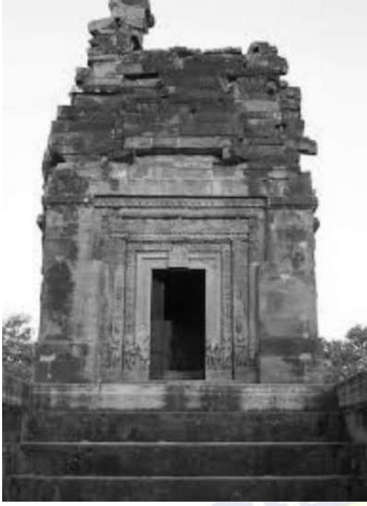
देवगढ़ का दशावतार मन्दिर