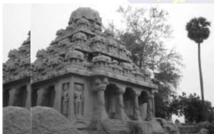
महाबलीपुरम् का तटीय मंदिर एवं युधिष्ठिर रथ