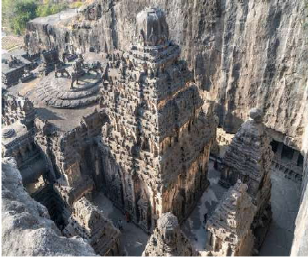
कैलाश मंदिर, एलोरा

अतिरिक्त एलोरा गुफाओं को भव्य कैलाशनाथ मंदिर के कारण भी जाना जाता है। एलोरा के कैलाशनाथ मंदिर के प्रतिमा शास्त्रीय निरूपण में शिव, शिव-पार्वती, कैलाश पर्वत को हिलाता रावण, दुर्गा, विष्णु, सप्तमातृकाएँ, गंगा, गणेश, यमुना तथा सरस्वती देवियों को भी स्थान मिलता है। वस्तुतः कैलाश मंदिर को उपमहाद्वीप के गुफा स्थापत्य का चरमोत्कर्ष कहा जाता है।